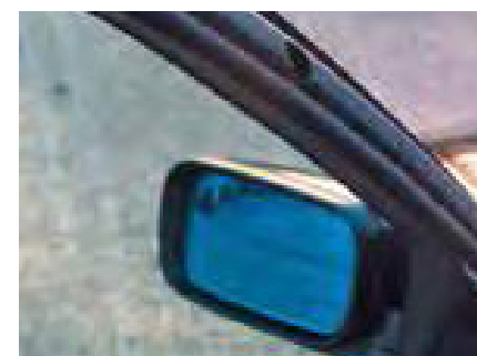
Beschadigingen aan interieur door gedemonteerde accessoires