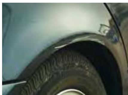
Krassen tussen de 2 en 10 cm in een grotere hoeveelheid dan aanvaardbaar geacht