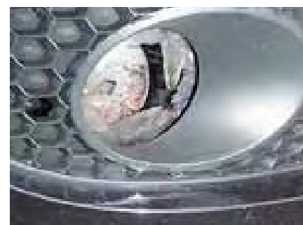
Een scheur of een gat in een koplamp of mistlamp