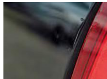
Een deuk kleiner dan een muntstuk van 50 eurocent