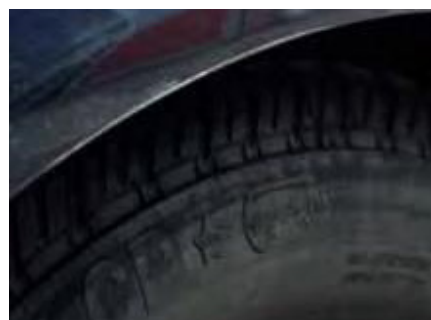
Een kras tussen de 2 en 10 cm