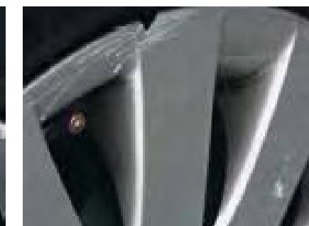
Zichtbare vervorming aan een velg of wieldop