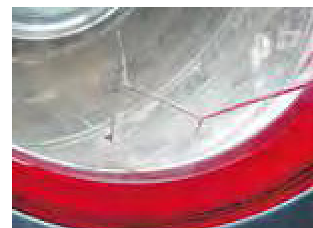
Een gebarsten voorruit met een begin van scheurvorming