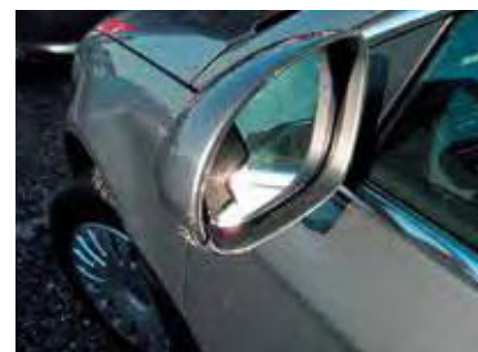
Afgerukte of loshangende spiegels