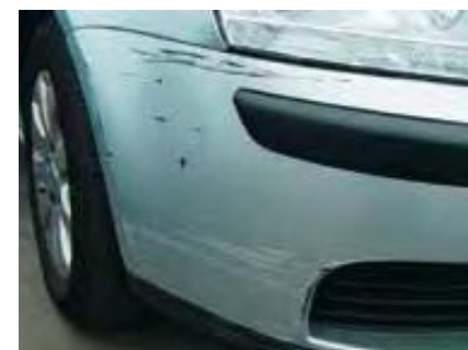
Beschadigingen op deze onderdelen groter dan een creditkaart