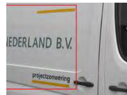
Reclame op voertuigen