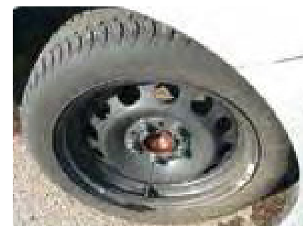
Ontbrekende wieldoppen of velgen