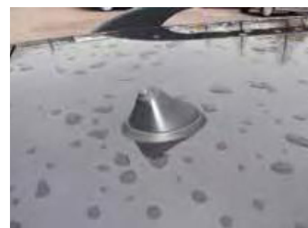
Een ontbrekende of verwijderde antenne