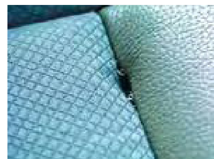
Scheuren, gaten of krassen in het auto-interieur

Beschadigde of ontbrekende (laad)kabels (uiteraard alleen als deze waren geleverd bij de auto).