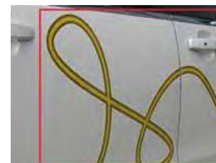
Reclame op voertuigen