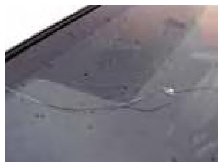
Krassen op de voorruit of steenslagschade