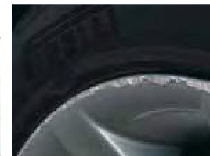
Gebarsten of gekraste velgen of wieldoppen