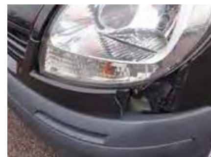
Gebroken, gebarsten, vervormde of losgelaten bumpers, grills of stootstrips