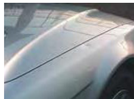
Deukjes van meer dan 2 mm diep, of groter dan een muntstuk van 50 eurocent